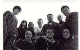
CHAPMAN TAYLOR ARCHITETTI